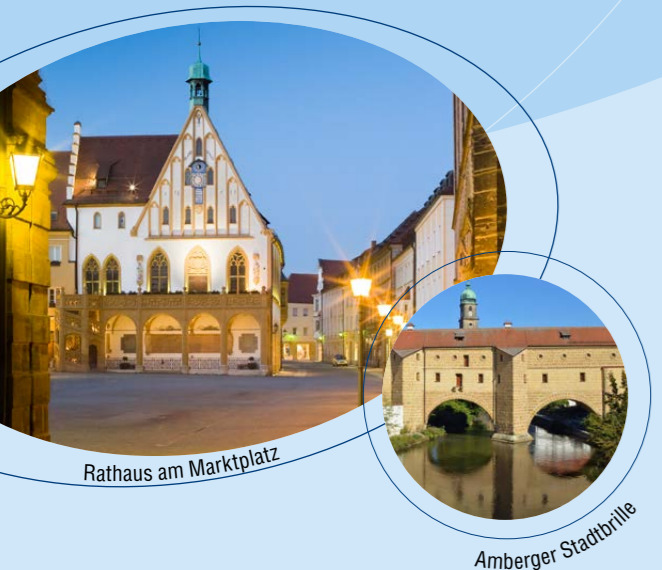
Rathaus am Marktplatz

Über 15.800 km 2 Verbundgebiet stehen Ihnen weit offen. Mit nur einer VGN-Fahrkarte können Sie über 800 Bus- und Bahnlinien nutzen – ganz bequem und weiterhin günstig. Denn der VGN hält das passende Angebot bereit: für gelegentlich Fahrende genauso wie für viel Fahrende, für Beruf, Shopping oder Freizeit.