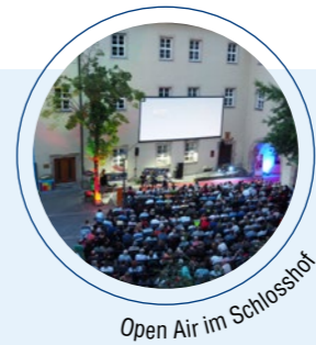
Open Air im Schlosshof