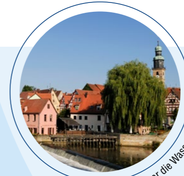
Stadtansicht über die Wasserbrücke

Den Verlauf der Schulbuslinie 350 entnehmen Sie bitte dem Fahrplanbuch.