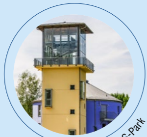
Schauturm im LGS-Park

Gute Fahrt wünschen Ihnen die Stadtwerke Neumarkt und der VGN!