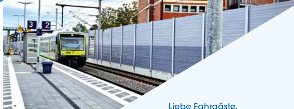
Ein Zug von Agilis am neuen Haltepunkt Forchheim Nord