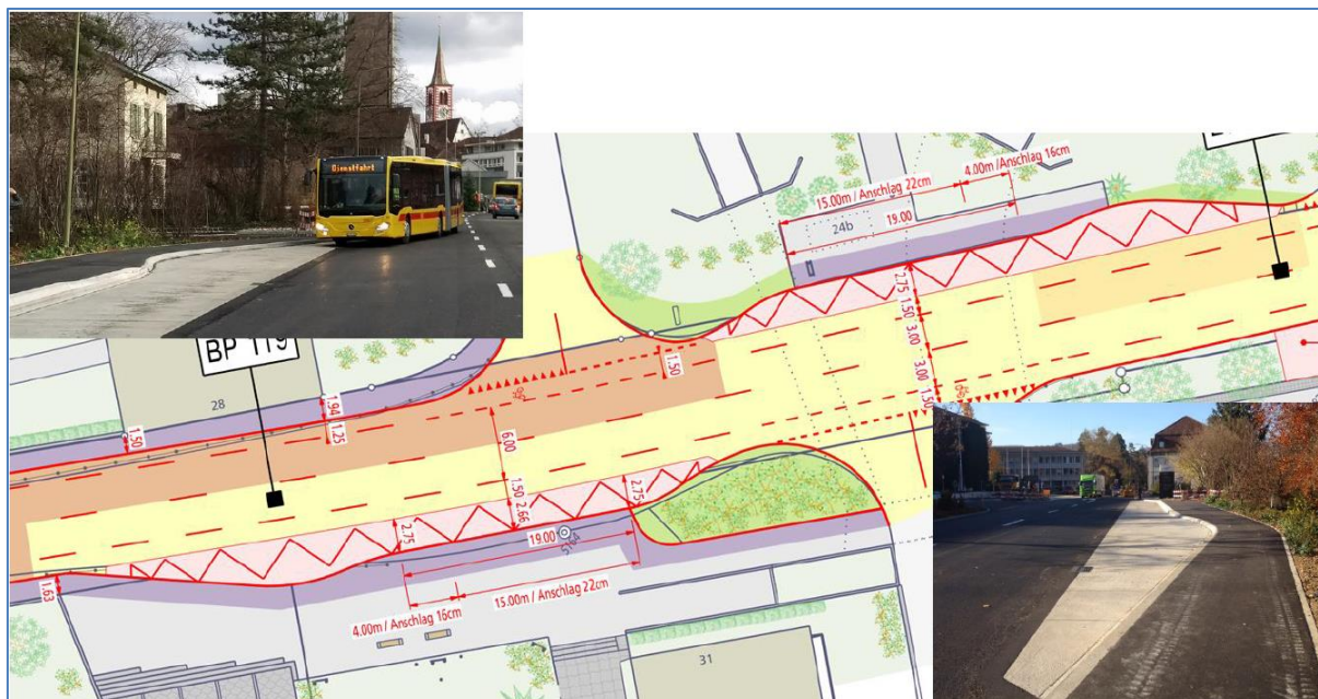
Abb.3: Busbucht mit Nase, Beispiel Kanton Basel-Landschaft