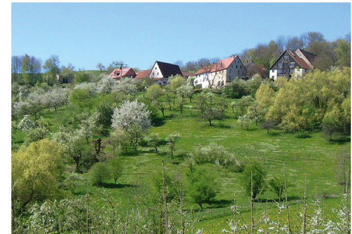
Lillinghof (16.04.2005,)

Bei den Wochenendgrundstücken nicht nach rechts, sondern geradeaus.