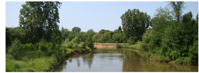
Im Pegnitzgrund bei Fürth

Zur 45 km-Tour ab Nürnberg Hauptmarkt kann man in Nürnberg und Fürth an beliebiger Stelle aufbrechen. Man fährt einfach zur Pegnitz in Nürnberg und folgt ihr nach Westen, am Ortsteil Schniegling vorbei und weiter nach Fürth. Hier führt der Weg ebenfalls an der Pegnitz entlang bis zur Einmündung in die Rednitz (kurz vor der Fürther Kläranlage) und dann an der Regnitz weiter geradeaus bis Stadeln .