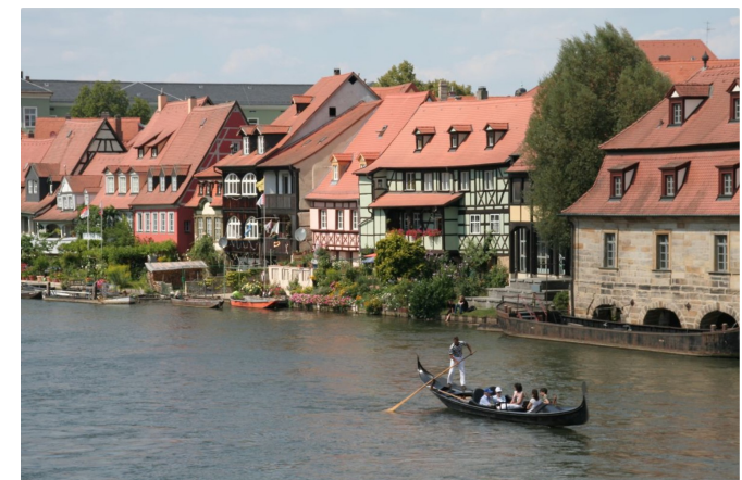
Stillecht: Wer möchte, kann sich in einer venezianischen Gondel kutschieren lassen.