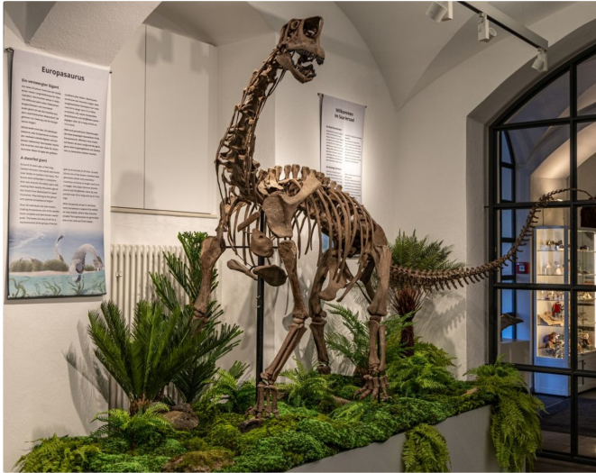
Das beeindruckende Skelett des Europasaurus im Naturkundemuseum Bamberg (Dr. Oliver Wings © Naturkundemuseum Bamberg)

Die Fleischstraße gegenüber bringt euch anschließend zum Naturkundemuseum Bamberg .