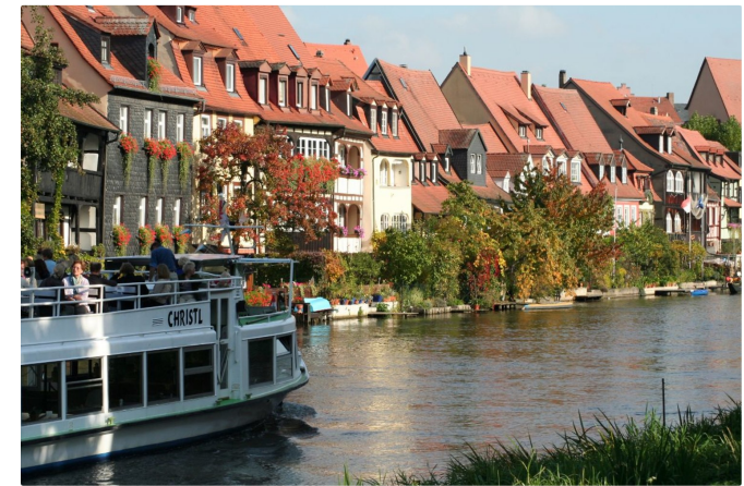
Dicht gedrängte Fachwerkhäuser aus dem Mittelalter und winzige Gärten direkt an der Regnitz: Klein Venedig mit dem Ausflugsschiff.

Am Leinritt spaziert ihr durch Klein-Venedig .