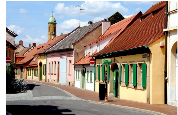
Das Gärtner- und Häckermuseum zwischen den bunten Häuschen der Altstadt.

Zurück zur Heiliggrabstraße und jetzt aber rechts weiter und wieder rechts in die Spitalstraße zum Gärtner- und Häckermuseum .