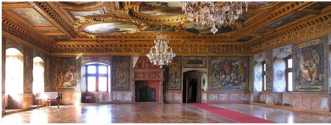
Zeugnis vergangener Zeit: Der Prunksaal im Schloss Ratibor

Von Schloss Ratibor aus gehst du stadtauswärts, passierst das Luitpold-Denkmal an der Außenseite des Schlossgartens.