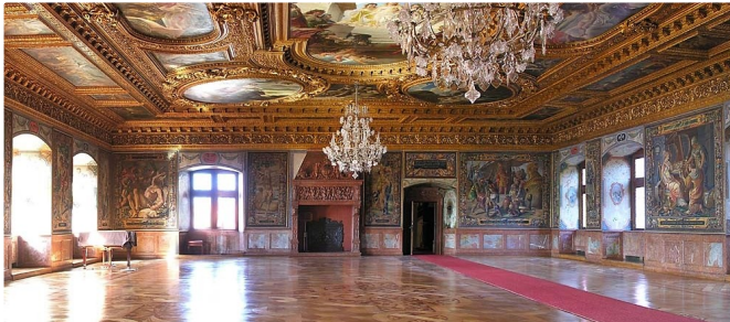
Schloss Ratibor Prunksaal

Das Wahrzeichen und Schmuckstück der Stadt Roth ist das Schloss Ratibor. Das zwischen 1535 und 1538 von Markgraf Georg dem Frommen errichtete repräsentative Jagdschloss wurde von den Einkünften des Regenten aus seinen schlesischen Besitzungen finanziert. Er nannte es deshalb „Schloss Ratibor an der Retzet“. Hauptattraktion und größter Raum des Schlosses ist der Prunksaal. In seiner Gestaltung erinnert er an italienische Säle der Spätrenaissance. In weiteren Räumen befindet sich das Stadtmuseum.