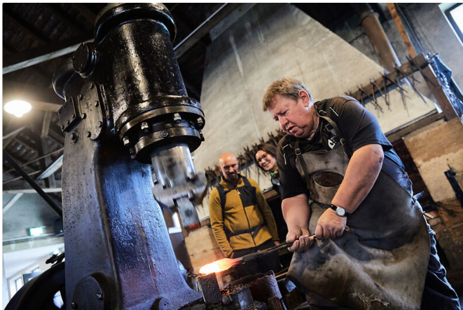
Historischer Eisenhammer Roth (Landkreis Roth)

Auch heute noch werden die Hämmer durch die Wasserkraft betrieben – und an den Aktionstagen finden Schau-Schmiedevorfürungen statt.