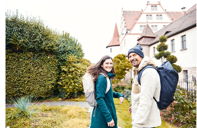
Schloss Ratibor

Das ehemalige Jagdschloss des Markgrafen von Brandenburg-Ansbach ist gefüllt mit Leben und Kunst. Kinder treffen dort auf ein Gespenst und eine Spielzeugsammlung, Erwachsene auf traditionelle, fränkische Hafnerkeramik und das Schmuckstück des Schlosses, den Prunksaal. Die „gute Stube“ lässt einen in die Bürgerhäuser zu Beginn des letzten Jahrhunderts blicken.