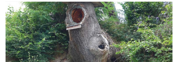
Naturdenkmal Steineiche (15.09.2020,)

Die Route steigt bergan, auf der Höhe folgst du weiter dem Wegweiser 01 Fatschenbrunn – am zweiten Verzweig mit doppelter Markierung Fatschenbrunn nimmst du den linken Abzweig. Am