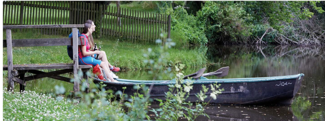
Pause am Weiher (17.07.2020,)