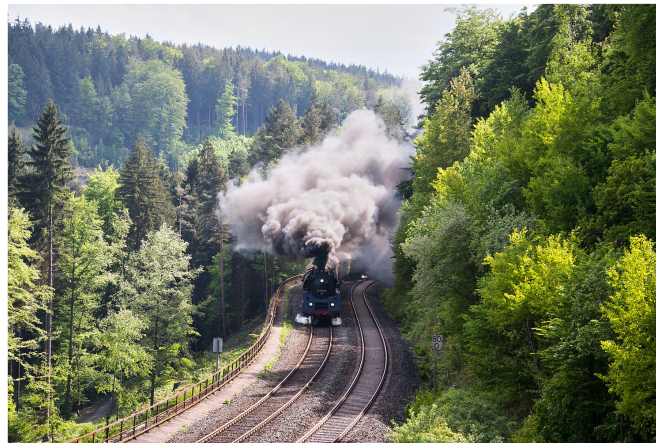
Dampfloklerlebnis mit dem VGN

Am hohen Steindamm dann hinab zu weiteren Infotafeln und zur Bahnbrücke No. VII . Die ist mit 44 m Höhe und elf Bögen das gigantischste Bauwerk der Schiefen Ebene.