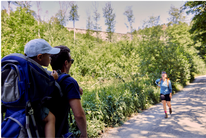
Eisenbahnerlebnis im Deutschen-Dampflokuseum

Durch den Tunnel geht es weiter zum Fotopunkt Steigungsfinale und zur Wasserkaskade . Hier gibt es auch eine Hörstation zur Eisenbahngeschichte mit Originalaufnahmen aus fünf Jahrzehnten Lok-Historie.