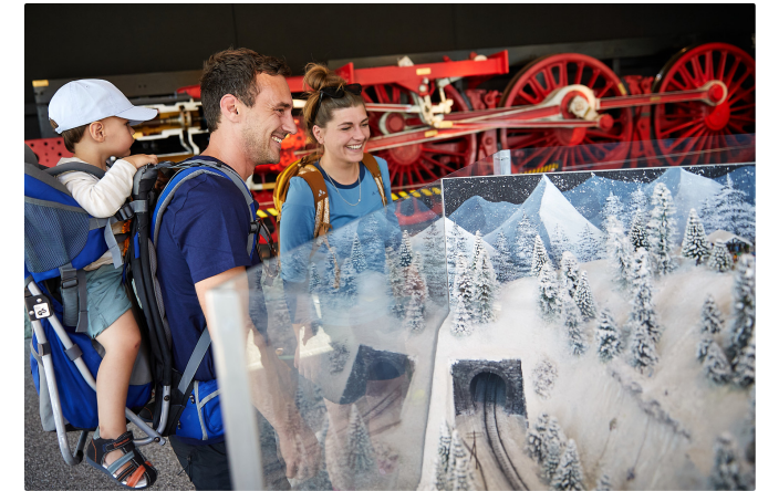
Familiertour mit dem VGN ins Deutsche Dampflokuseum (23.06.2023,)

Mit Markierung SE geht es schließlich ins Eisenbahndorf Neuenmarkt und dem abschließenden Highlight der Tour – dem Deutschen Dampflokotiv Museum .