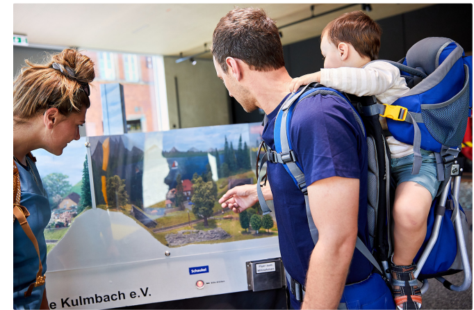
Eisenbahnerlebnis im Deutschen-Dampflokotiv-Museum