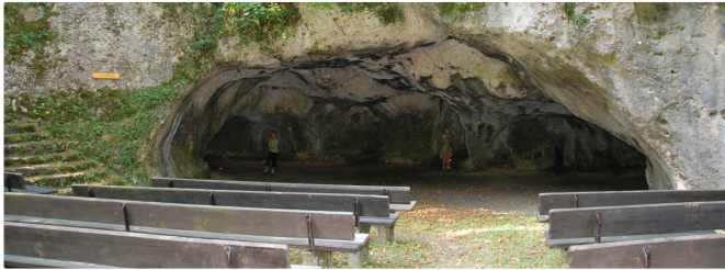
Auf der Ludwigshöhe

Du steigst die Stufen hinauf zur Ludwigshöhe mit einem weiteren Aussichtspunkt und einer großen Höhle , in der auch Veranstaltungen stattfinden.