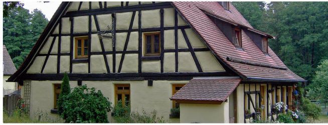
In Furth