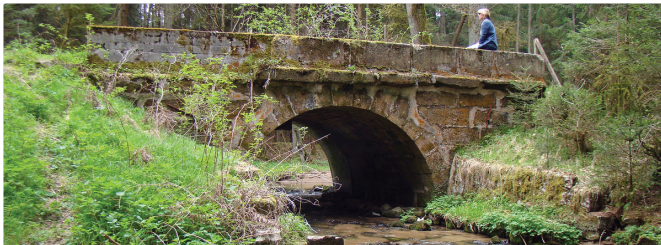
Sandsteinbrücke (30.04.2012,)

Ohne Wanderzeichen beginnen wir unsere Wanderung, erst am Gehsteig, dann ein kurzes Stück auf der Heiligenmühlstraße (nicht in der Brunner Hauptstraße) aus dem Ort hinaus bis zum Wanderparkplatz. Auf der gegenüberliegenden Straßenseite, beim Sperrschild für Autos/Motorräder, folgen wir dem mit dem ☐ markierten Wanderpfad, der ca. 30 m versetzt, links parallel zur Hauptstraße verläuft. Unmittelbar vor den Leitplanken der A 3 geht es die Steintreppen hinunter, dann links durch die Unterführung. Nach der Abzweigung Richtung Altdorf/Ungelstetten übernimmt kurz dahinter der Fränkische Dünenweg 8 nach rechts die Führung entlang des wildromantischen Röthenbaches. Der harmonische Pfad – mitunter auch durch die lokale 8 ausgeschildert – windet sich am oft sandigen Bachlauf entlang und überquert zunächst auf einer Holzbrücke einen kleinen Zufluss.