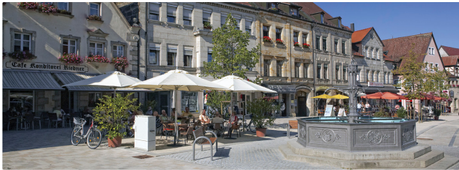
Ortsmitte (27.08.2009,)

Wanderzirkus Frankenalb bald den Ortsrand des Altdorfer Ortsteils Hegnenberg (0,4 km). Rechts hinein, dann hinunter bis zum Traditionsgasthaus „Zur Schönen Aussicht“, das vor allem in den Sommermonaten von der Terrasse aus seinem Namen alle Ehre macht ...