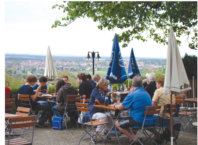
Biergarten „Zur schönen Aussicht“ (30.04.2012,)