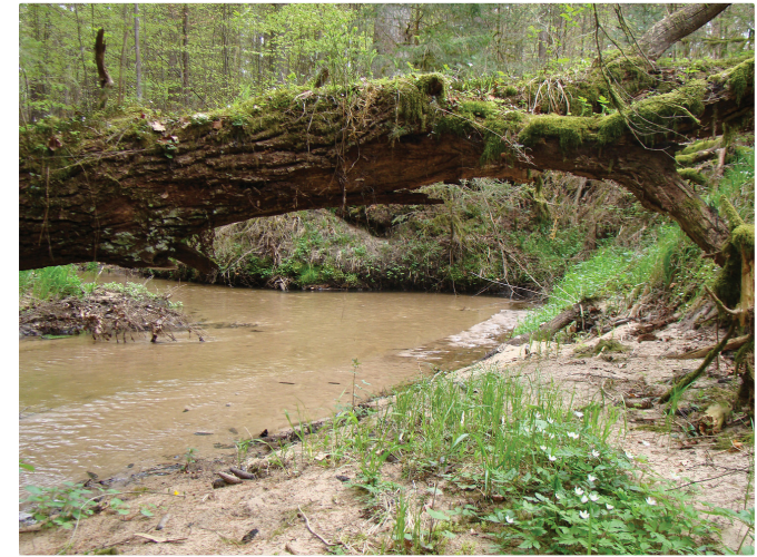
Im Röthenbachtal (30.04.2012,)

Gleich zu Beginn der Tour wartet das liebevolle Röthenbachtal auf uns. Dieser kurze Abschnitt des Fränkischen Dänenweges ist für jeden Wanderer ein Genuss. Überwiegend durch den Fichten- und Föhrenbestand des „Steggerlaswaldes“ verläuft die mittlere Passage der Route vor den Toren Nürnbergs. Außer dem knackigen Anstieg von Weißenbrunn hinauf zur Klingenhofer Höhe sind keine weiteren Anstrengungen zu bewältigen. Die Wanderung kann auch in Weißenbrunn (Bus 331) begonnen oder beendet werden.