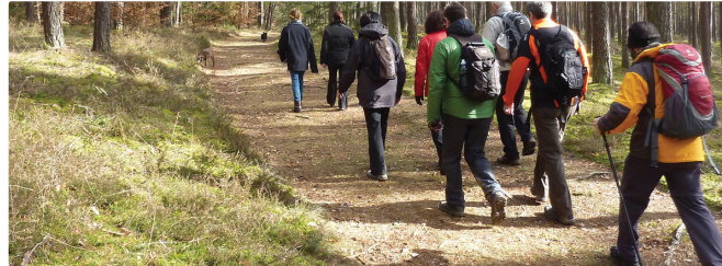
Waldpfad (27.04.2012, VGN)

Hand in einen Pfad abzweigt und uns dem Bachlauf wieder näher bringt. Oberhalb der Sandsteinschlucht verlassen wir dann das Röthenbachtal und folgen bei der Hinweistafel dem ☐ bis Weißenbrunn (8 km). Ein schmaler Pfad führt wieder zurück zum Hauptweg. Dort rechts und beim nächsten Abzweig links quert der Weg die breite Trasse der Stromleitung. Anschließend aufgepasst – geradewegs geht es auf einem schmalen Pfad in den Wald hinein. Schnurgerade durch den Steggerlaswald – weiter stets den ☐ vor Augen – treffen wir wieder auf einen breiten Forstweg ( km 4,1 ).