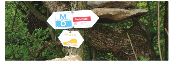
Unsere Wegzeichen (30.04.2012,)

Über ein kleines Bächlein, dann am Waldrand entlang, es geht vorsichtig über die Straße und auf einem Wiesenweg zwischen den Feldern auf das Sportgelände zu. Zwischen den beiden Tennisplätzen hindurch geht es unmittelbar danach halblinks hoch über eine kleine Kuppe, am Ortsrand in den Lehmweg hinein nach Weißenbrunn . Gleich nur kurz rechts (Föhrenstraße), dann links, bleibt nach wie vor der ☐ als Markierung. Nun wechseln wir in der Weißenbrunner Hauptstraße die Straßenseite und kommen bald zur Kreuzung Winner/Ernhofers Straße ( km 10,3 ).