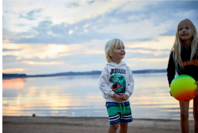
Am Badestrand Brombachsee (07.09.2022,)

Bis zu 750 Passagiere können auf den drei großzügig angelegten Decks an Bord des einzigartigen Trimarans „MS Brombachsee“ gehen, ein richtig großes Schiff also! Fahrscheine fürs Schiff gibt's direkt an Bord, der Fahrplan ist hier zu finden.