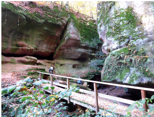
Schnittlinger Loch