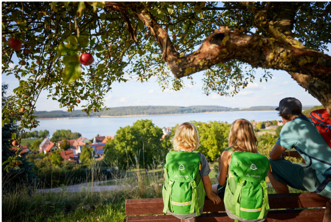
Panoramablick über den See (07.09.2022,)

Bevor wir nach rechts zum See hinuntergehen, ist ein Abstecher nach links schön. In der Ortsmitte sind die Touristinfo im Harsdörfer Schlösschen plus Wellnesskräutergarten , Unterkünfte, Einkehr-möglichkeiten und ein Bauernladen mit verschiedenen regionalen Köstlichkeiten.