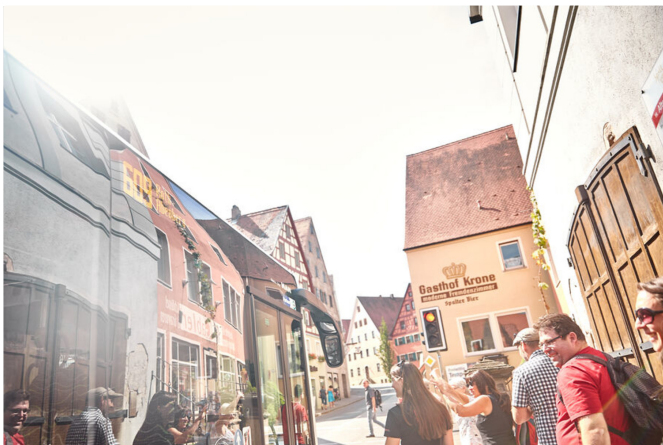
Unterwegs in Spalt (20.07.2019,)

Mit dem Alten Rathaus zur Rechten laufen wir am Gasthaus Krone vorbei und beim Café „Alte Backstüb“ schräg rechts hinauf. Es geht an historischen Häusern vorbei. Zum Trocken des Hopfens war es einst typisch, gleich fünf Dachgeschosse zu bauen, mit entsprechend steilen Dächern.