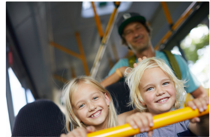
Auf zum Familien-Abenteuer (07.09.2022,)