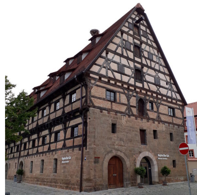
Kornmuseum Spalt (24.08.2017,)

Idyllische Weiher folgen, es geht in den schönen Wald. Immer wilder wird die Szenerie. Am Schnittlinger Loch (km 3,2) führt unser Weg nach links über ein kleines Holzbrücklein – und danach über angeblich 116 Stufen nach oben. Wir haben die aber nicht gleich