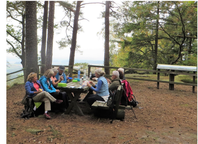
Rast am Veitenstein (09.02.2018,)

Am Bergücken entlang geht es mit in den Lußberger Forst und zum pittoresken Veitenstein mit Schutzhütte und Rastplatz – Aussichtspunkte inklusive.