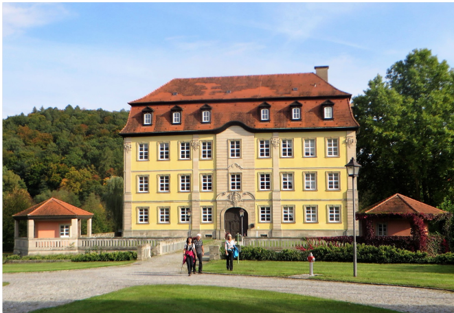
Schloss Gleisenau (09.02.2018,)

Quelle: https://www.hassberge-tourismus.de/detail/id=5fbe0f3e593cfa2c7c6a1d30