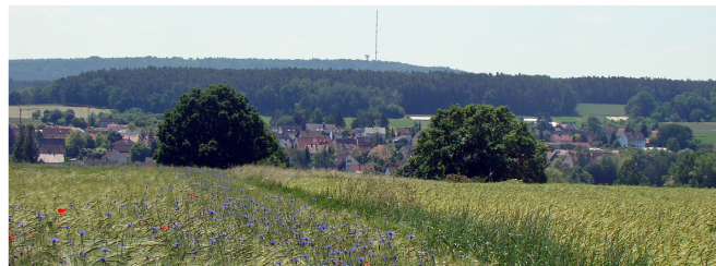
Blick auf den Heidenberg (04.02.2016,)

Du hältst dich am Ortsrand rechts und folgst der Markierung über Waldpfade und am Vogelkundigen Lehrpfad entlang mit Blicken über das Schwabachtal bis hin zum Sendemasten am 462 m hohen Heidenberg .