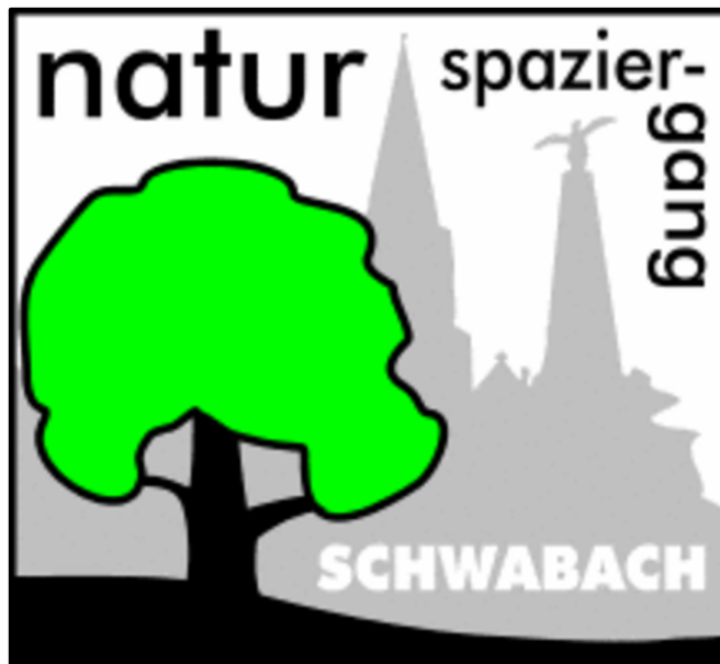
Naturspaziergang Lehr-logo (04.02.2016, VGN)

Mit dem Wegezeichen Schwabacher Naturspaziergang geht es am ehemaligen US-militärischen Sperrgelände in den Schwabacher Stadtteil Eichwasen .