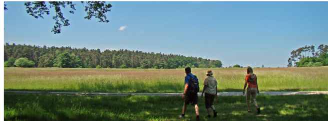
Vor dem ehemaligen US-Gelände (04.02.2016,)

Du hältst dich am Ortsrand rechts und folgst der Markierung über Waldpfade und am Vogelkundigen Lehrpfad entlang mit Blicken über das Schwabachtal bis hin zum Sendemasten am 462 m hohen Heidenberg .