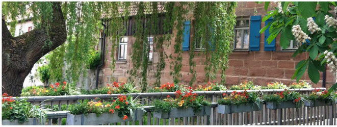
Schwabachbruecke (04.02.2016,)

Von hier aus erreichst du den Bahnhof S2/ R in rund 30 Gehminuten. Folge dazu der Ludwig- , dann der Bahnhofstraße am Stadtpark vorbei.