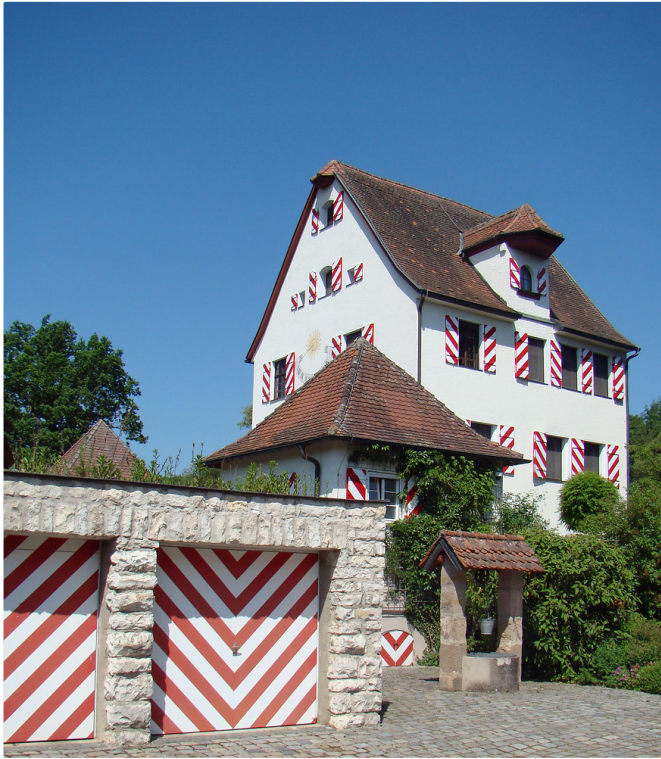
Wasserschloss (04.02.2016,)

Rechts auf Am Wasserschloss weiter und auf Untere Pfaffensteigstraße schließlich aus dem Ort hinaus.