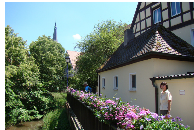
An der Schwabach (04.02.2016,)