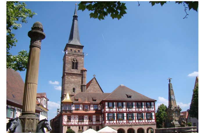
Pferdebrunnen Rathaus und Stadtkirche (04.02.2016,)