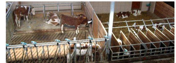
Kuhstall 2 (02.11.2016,)

Auf der Ritterstraße durch den Ort, dann links in den Asbacher Weg und mit der Markierung Druidenweg 1 an Hopfenfeldern entlang weiter nach Mäbenberg .