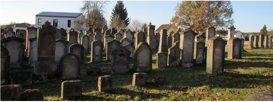
Judenfriedhof 2 (02.11.2016,)

Quelle: https://www.georgensmuend.de/de/freizeit-kultur-tourismus/sehenswuerdigkeiten/juedischer-friedhof