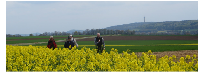
Blick zum Göschberg (14.02.2017,)

Du läufst zur Hauptstraße ( Eichenstraße ) und folgst der Markierung Frankenweg durch Nadelwälder , über Wildblumenwiesen und mit Fernsichten nach Döllwang .