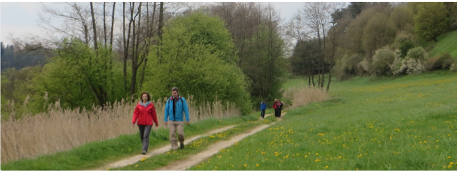
Im Tal der Weißen Laber (14.02.2017, VGN)